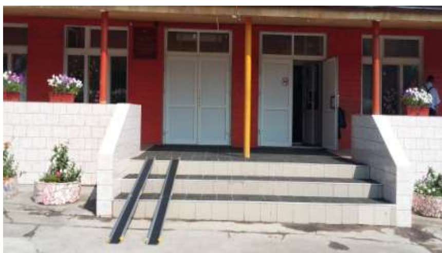
ВХОДНАЯ ГРУППА С ПРИЛЕГАЮЩИМ ПАНДУСОМ